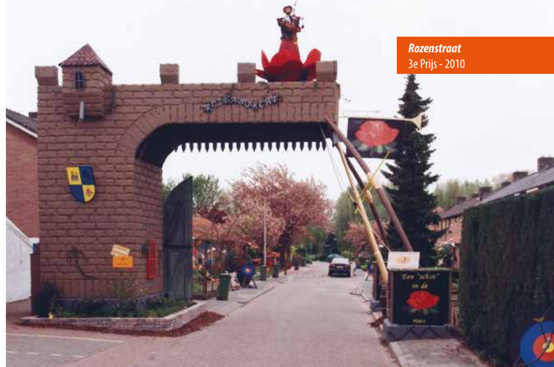
Rozenstraat 3e Prijs - 2010