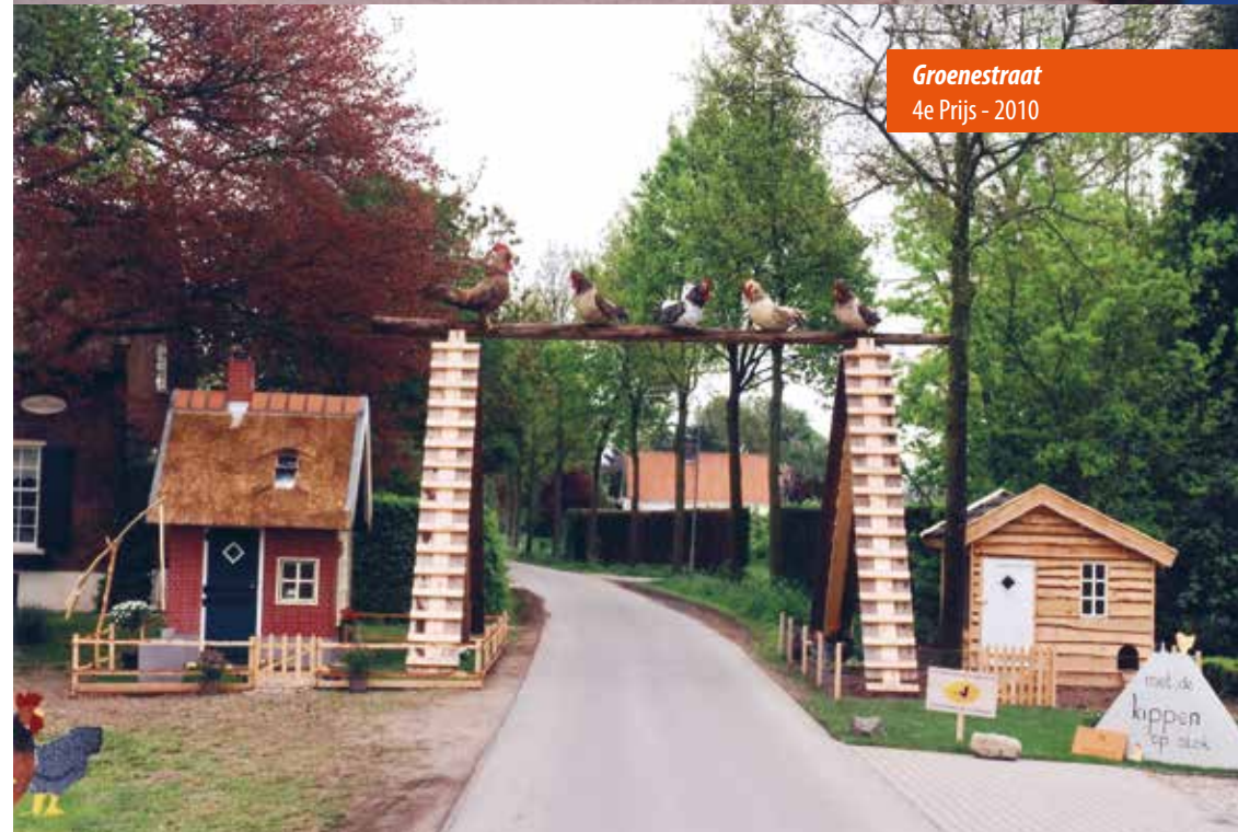
Groenestraat 4e Prijs - 2010